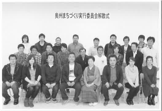
奥州まちづくり実行委員会解散式